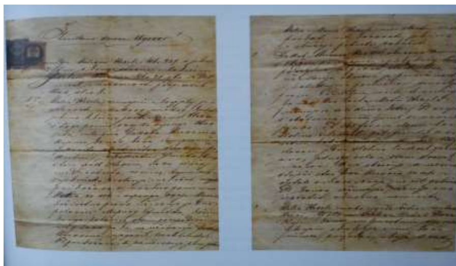
Slika 2 Ženidbeno-darovni ugovor od 8. svibnja 1868. godine