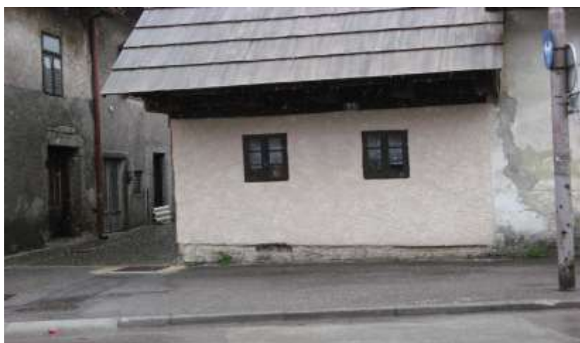
Slika 3 Kuća Rački, najstarija kuća u Delnicama

Izvornost običaja delničkih zaruka potvrđuje jedna osobitost vezana za prvu polovicu 19. st. Na dan zaruka žene i muškarci su prvi puta oblačili delničku narodnu nošnju napravljenu u tkaonici obitelji Rački .Prerada lana , konoplja i kože za potrebe odjevnih predmeta spominje se unatrag gotovo 400 godina , krajem 16. st. na ovim prostorima. Prvo su postojale pojedinačne tkaonice a kad je otvorena tkaonica obitelji Rački u njoj su radile mnoge žene našeg kraja a mlade su se djevojke dolazile učiti tkati.