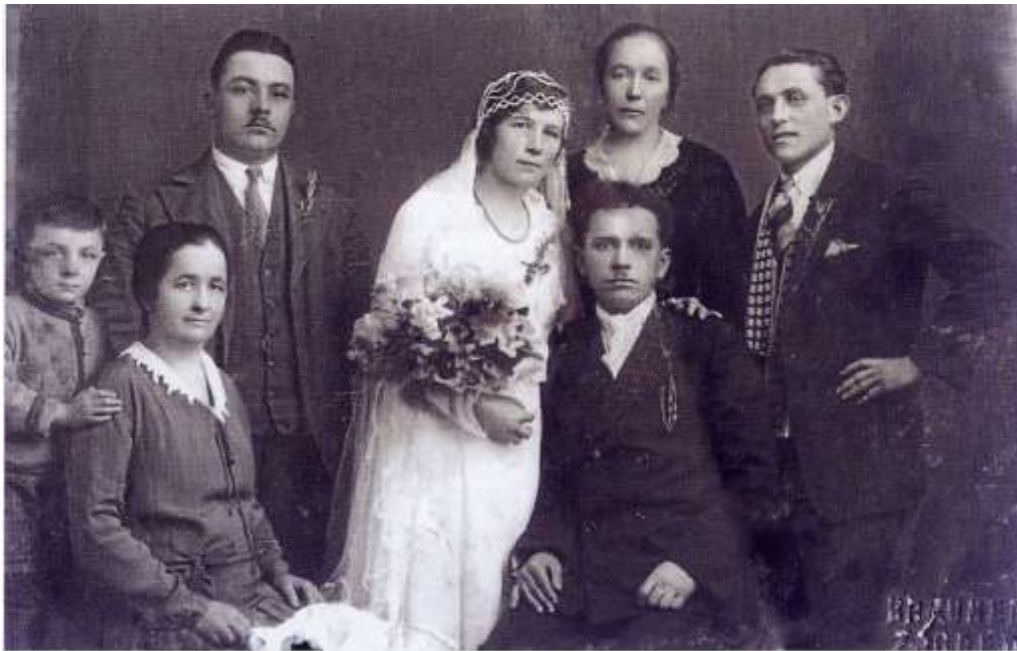
Slika 6 Vjenčanje iz 1927. godine

Usljedio bi odlazak do kuće mladoženje te susret sa svekrvom i svekrom kojoj po običaju snaha daruje smrekovu ili jelovu blagoslovljenu grančicu u znak poštovanja . Po običaju ta se grančica čuvala godinu dana na zidu. Svekrva bi darivala snahi jabuku koju bi ona prebacila preko stare dvorišne ograde a to bi značilo da se neće vratiti svojoj kući. Snaha je u kuću svoga muža kročila zajedno sa njime desnom nogom te tako uz Božji blagoslov ušla u svoj novi dom. Svatovi bi tada ostali u dvorištu slaviti, za to vrijeme mladence je u kući dočekaio zobenih kruh na lanenoj prostirci . Probati kruh značilo je ne doživjeti siromaštvo , već živjeti u izobilju. Za stolom bi mladenka u krilo dobila muško dijete uz želju da i ona što prije takvo rodi .Potom bi se mladi vratili u dvorište da nastave pirovanje.