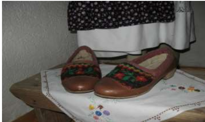
Slika 5 Univerzalna obuća za svatove i svakodnevicu

19.st. a nakon toga platno se nabavljalo iz drugih krajeva što je rezultiralo promjenama u izradi narodne nošnje .