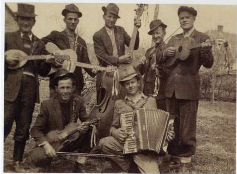
Delnički svirači iz prve polovice 20. stoljeća

Delničani bi pirovali i u svratištu obitelji Petranović na Luzinjskoj cesti te u Bakanovoj gostionici u Grabnju . Ondje se uz vanjska ognjišta pirovalo do ranih jutarnjih sati . Tamo bi mlade dočekali tamburaši i harmonikaši uz narodne pjesme « Luzjanku» i «Jezerku».